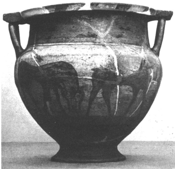
Figura 1. Cratera de Sabucina.

mais ainda, um sentimento de homogeneização ao longo da Idade do Ferro (Cf. Hodos, 2006; Dietler, 2010).